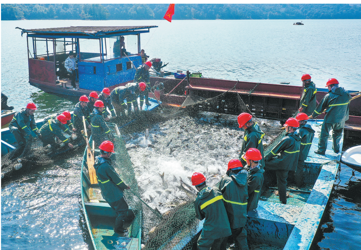
近日,崇义章源控股有限公司阳明湖渔业分公司员工在阳明湖捕鱼。近年来,崇义县高度重视水生态发展,严格落实湖长制,强化湖泊保护管理,推行人放天养模式,达到“以鱼净水、养鱼增收”的目的,实现生态效益和经济效益双丰收。

这是全南县加快推进分级诊疗建设,让群众就近享受优质医疗服务的生动实践。近年来,全南县深化紧密型县域医共体改革,结合县域特点、人口分布等实际情况,打破原有医疗资源分布格局,探索“1+2+N”分级诊疗新模式,打造了1个龙头、2个次医疗中心、12个医疗点,让群众在家门口