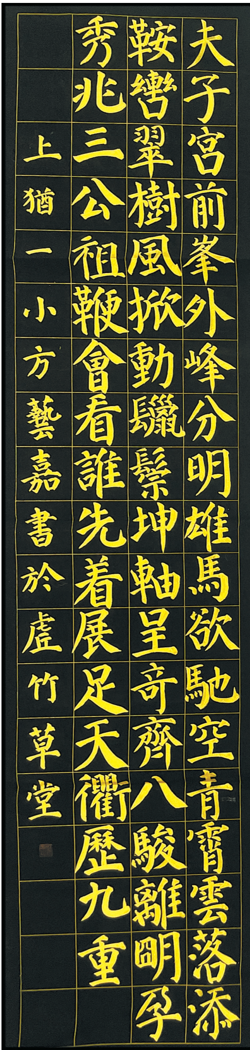
骏马驰骋 上杭一小五(七)班方嘉 (指导老师:欧阳浩)