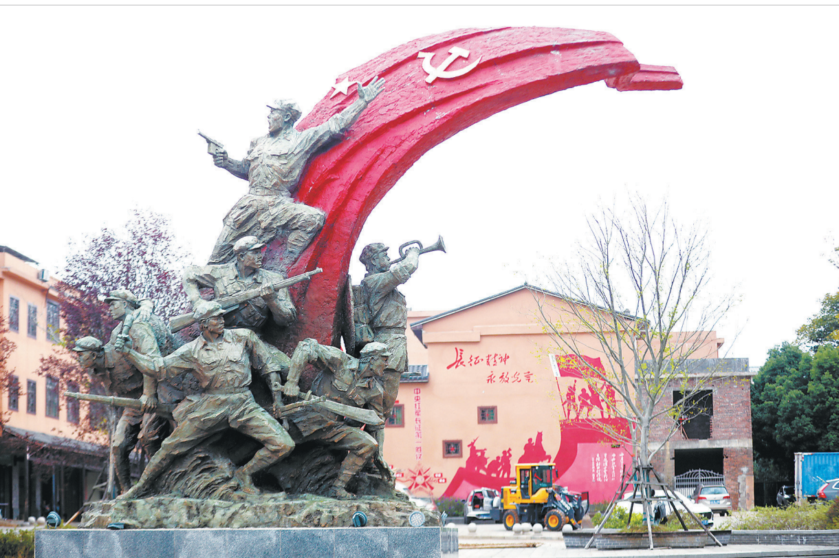
信丰县新田镇百石村是全国红色美丽乡村试点村，岁月流转，长征第一仗战场“变身”美丽村庄。

分享会前夕，长征沿线省份优秀青年代表、江西省大学生代表、基层青年干部代表等800余人参加了首届新时代青年“重走长征路”徒步活动。