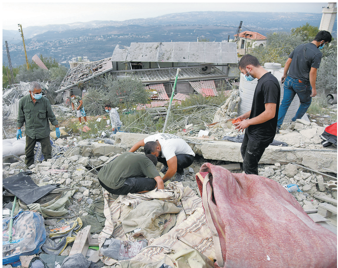
10月12日,在黎巴嫩拜特鲁地区一小城,人们清理空袭后的废墟。

据报道,近日黎以冲突升级以来,已有5名联黎部队维和人员受伤。参与向联黎部队派遣维和人员的40个国家12日发布联合声明,强烈谴责最近对联黎部队维和人员的袭击。